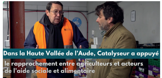
Dans la Haute Vallée de l'Aude, Catalyseur a appuyé le rapprochement entre agriculteurs et acteurs de l'aide sociale et alimentaire

CUMA de l'Aude ont approfondi leur coopération. Ensemble les deux réseaux ont développé un projet d'approvisionnement de la Banque Alimentaire, à juste prix pour les producteurs et en circuit court, afin d'augmenter la part de fruits et légumes frais et locaux redistribués aux associations partenaires.